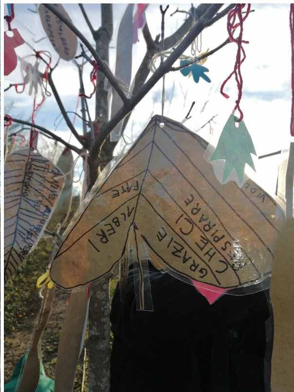
le bambine e i bambini, gli insegnanti della 2A primaria Venturi Monteveglio-Bo